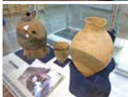
絵鞆2遺跡からの出土物

旧絵鞆小学校敷地内をはじめ室蘭市内には多数の縄文／続縄文／擦文時代／アイヌ文化期の遺跡があります。