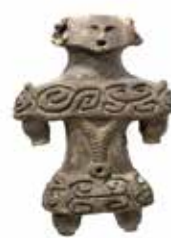
1918年（大正7年） 輪西遺跡で出土した土偶。 国の重要文化財

これらの展示物をご覧頂くことにより、ピラミッドより古い！？世界遺産級の！？はるか数千年前からこの土地で多くの人々の営みがあったことを体感していただけたらと思います。